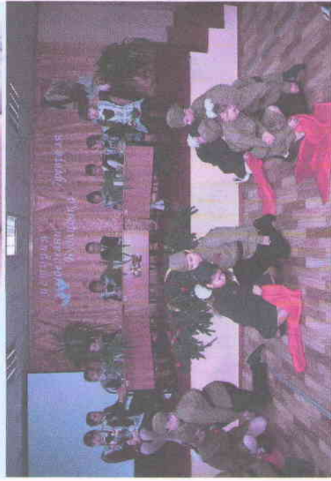
МБОУ «Будановская средняя общеобразовательная школа имени Героя»

МБОУ «Будановская средняя общеобразовательная школа имени Героя Советского Союза М.В. Грешилова» Золотухинского района Курской